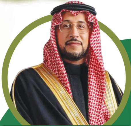
صاحب السمو الملكي الأمير